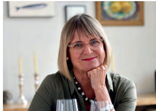
2019 Jancis Robinson Weinkritikerin aus London