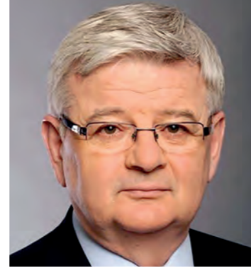
2023 Joschka Fischer ehemaliger Außenminister / Vizekanzler